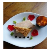
Foie gras nature