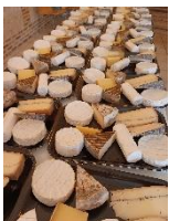
Plateau de fromages